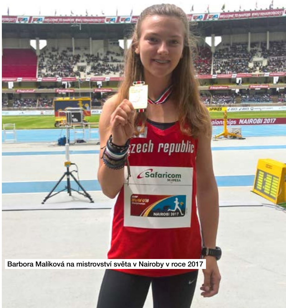
Barbora Malíková na mistrovství světa v Nairoby v roce 2017