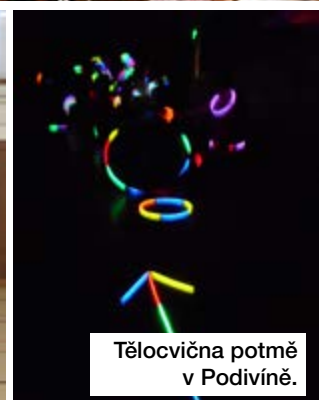
Tělocvična potmě v Podivíně.