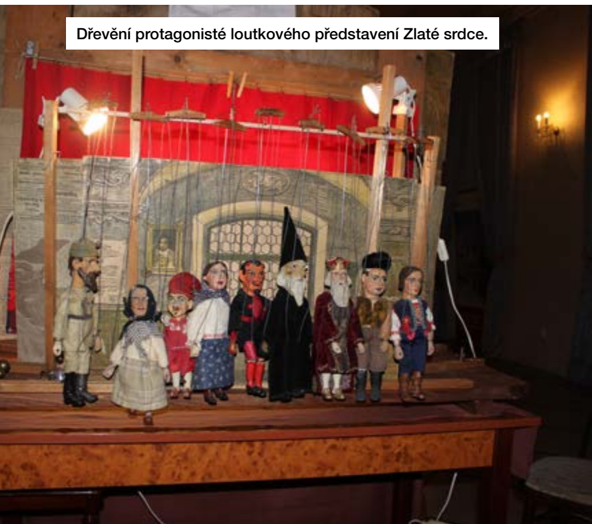
Dřevění protagonisté loutkového představení Zlaté srdce.