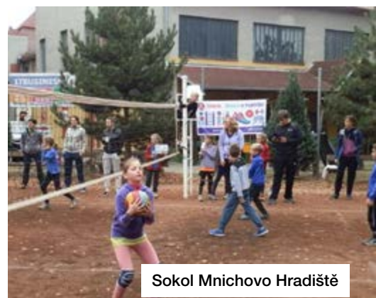
Sokol Mnichovo Hradiště