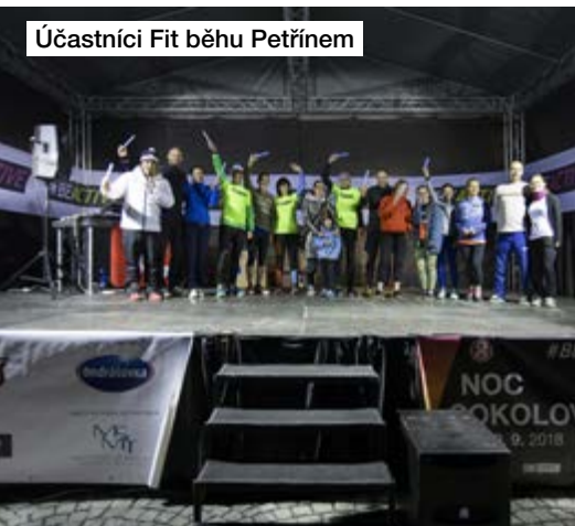
Účastníci Fit běhu Petřínem