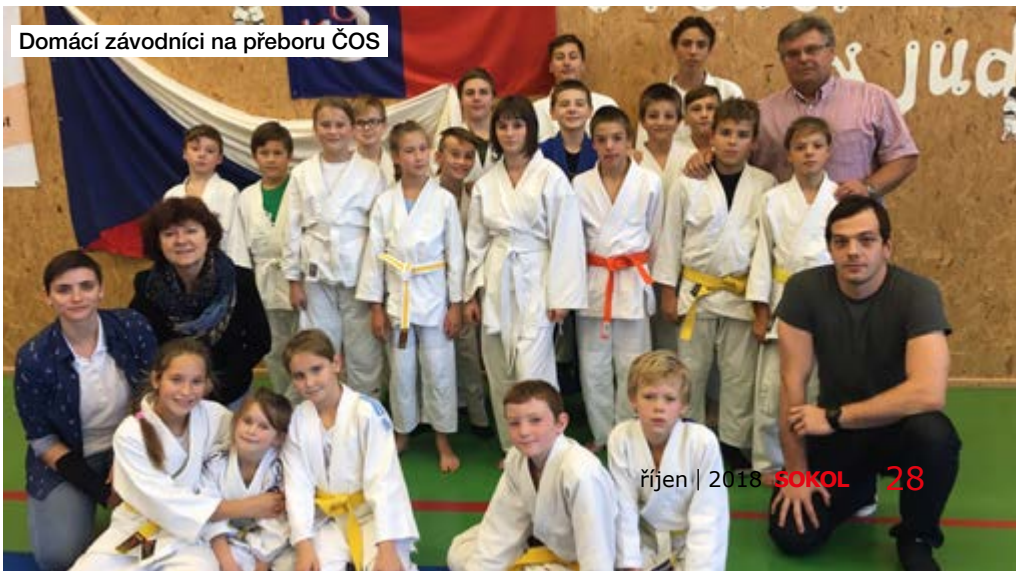
Domácí závodníci na přeboru ČOS