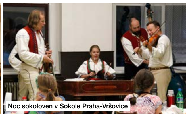
Noc sokoloven v Sokole Praha-Vršovice