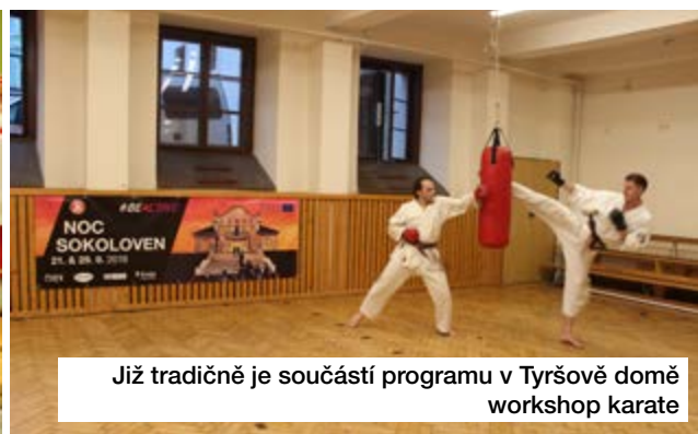
Již tradičně je součástí programu v Tyršově domě workshop karate