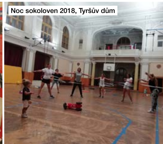
Noc sokoloven 2018, Tyršův dům