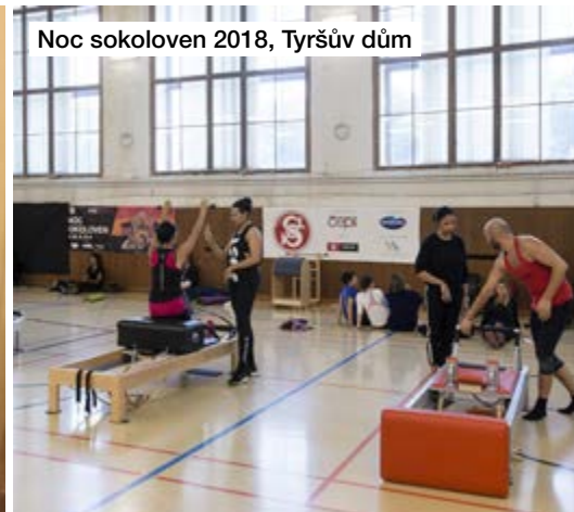
Noc sokoloven 2018, Tyršův dům