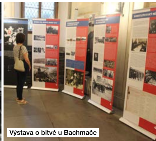
Výstava o bitvě u Bachmače