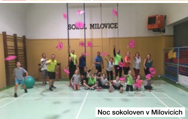
Noc sokoloven v Milovicích