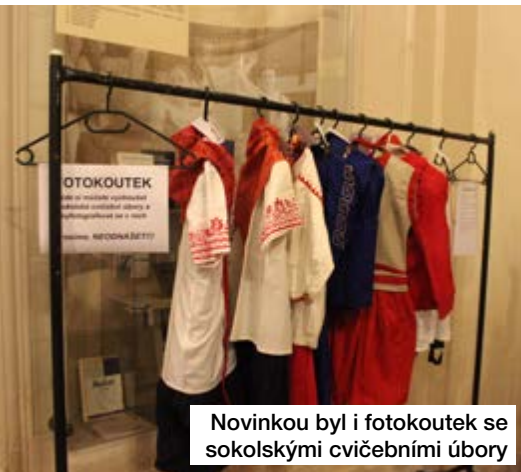
Novinkou byl i fotokoutek se sokolskými cvičebními úbory