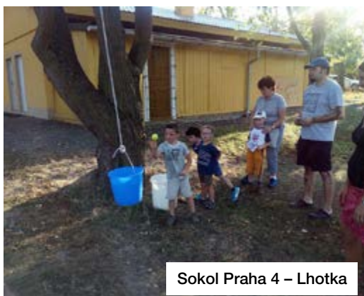
Sokol Praha 4 – Lhotka