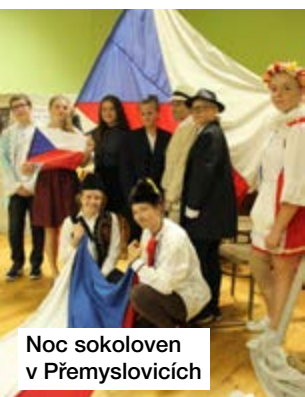
Noc sokoloven v Přemyslovicích