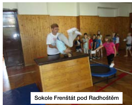
Sokole Frenštát pod Radhoštěm